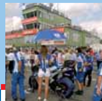
Automotodrom Brno: Sezóna 2009 str. 10