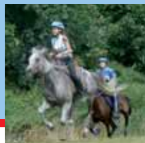
Vytrvalost – distanční dostihy str. 6