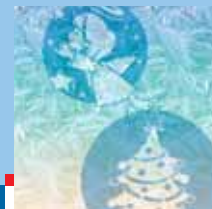
XVI. Vánoce na Brněnské radnici str. 12