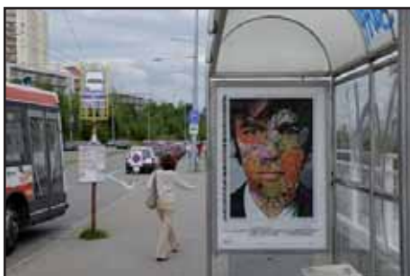
Co jsem se zatím v životě naučil. Stefan Sagmeister Brno - Nový Lískovec, P. Krivky / Koniklecová

Jelikož i na Moravě platí, že doma není nikdo prorokem, nepatří tři brněnské výstavní domy v čase letním mateřštině, nýbrž pestré směsi cizích řečí. Jako by těch 600 děl od 162 autorů z 27 zemí světa, které vybrala odborná porota z neuvěřitelného množství 1 500 nabídnutých položek od bezmála 400 autorů, neslibo-