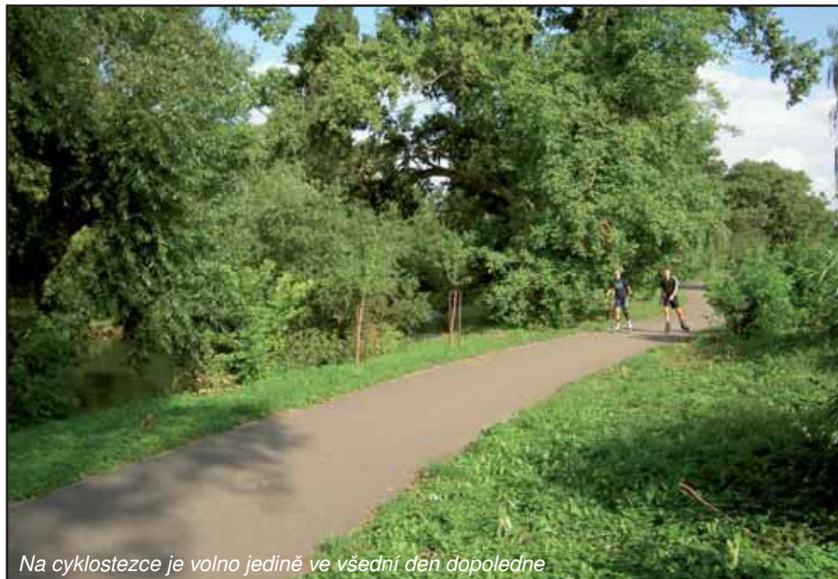
Na cyklostezce je volno jedině ve všední den dopoledne