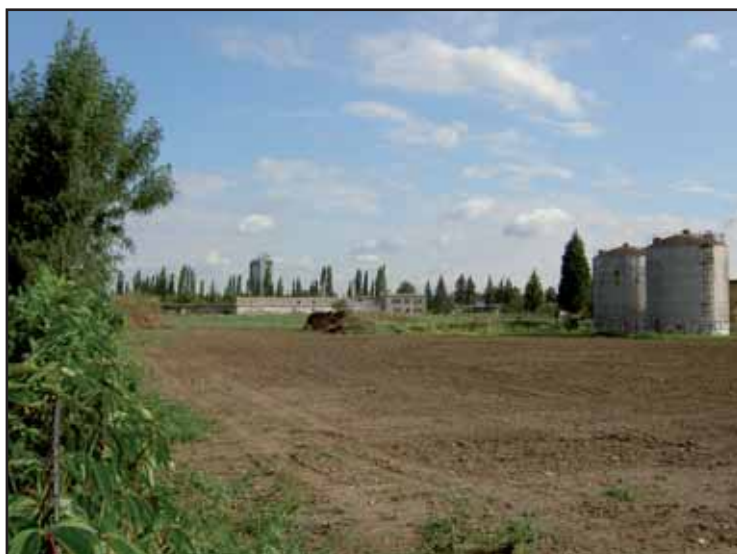
Dříve zelí a květiny, dnes lebeda a zítra se zde bude pěstovat sport

„Začali jsme s jejich budováním, když byly ještě in line brusle novinkou. Z trasy okolo Svatky se mezitím stala nejdůležitější sportovní tepna ve městě. Nyní se proto snažíme o podstatné rozšíření možností, jak se na tuto páteřní bezmotorovou komunikaci dostat a také jak využít co nejlépe i její okolí. Nejnověji tak lze od soutoku pohodlně dojet až k Holáseckým jezerům. V záměru je rozšířit cyklotrasu na oba břehy řeky, včetně související kultivace zbývajících břehů. V naší městské části není mnoho prostor, kam by se dalo zajet s kočárkem nebo jít na procházku se psem.“