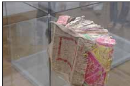
Osobitá kniha Fumia Tachibany

obrázky, linkami a písmenky. Autory této koncepce jsou Radim Babák a Ondřej Tobola (Hippos Design), pod vizuálním stylem celého bienále je letos podepsán Petr Štěpán (Studio Najbrt).