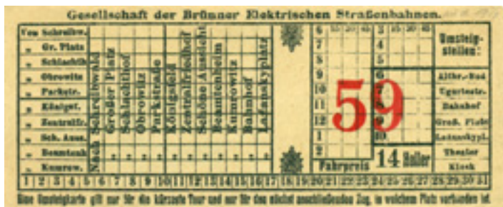
Jízdenka před rokem 1915