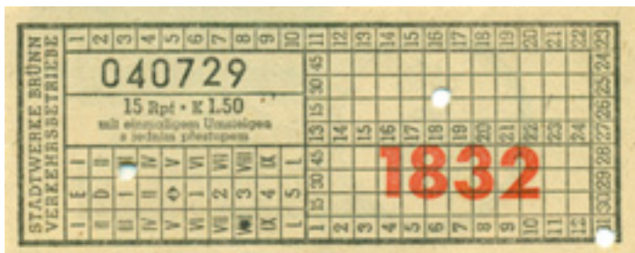
Jízdenka z let 1941–1945

Geny traťových jízdenek byly dle toho taktéž upraveny a zároveň zrušeny ceny do tří pásem.