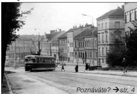
Poznáváte? → str. 4

V sobotu 18. července se uskutečnila další z akcí k letošnímu 140. výročí MHD v Brně – Den otevřených dveří v podzemní měničárně v Údolní ulici. Zájem obecnosti byl opravdu velký, vždyť takové zařízení není běžně přístupné. Měničárna slouží k transformaci a usměrňování střídavého napětí 22 kV, přiváděného přenosovou sítí, na stejnosměrné napětí 600 V. Tím je napájeno trolejové vedení pro tramvaje a trolejbusy. Proto jsou měničárny pro jejich provoz nezbytné. Pracovníci střediska Měničárny a kabelová síť DPMB připravili výklad o vlastním technologickém zařízení a fungování měničárny. Dále návštěvníci shlédli videoprojekci o všech 28 měničárnách dopravního podniku, dálkově řízených z centrálního energetického dispečinku v ul. Tábor, a mohli si prohlédnout i části historických technologických celků. Přítomní pracovníci měničárny byli zahrnováni dotazy, které svědčily o informovanosti a zájmu návštěvníků. Na závěr ještě dodejme, že tato podzemní měničárna byla uvedena do provozu v roce 2002 jako první svého druhu v Česku a je jedna ze dvou podzemních v Brně. (jb)