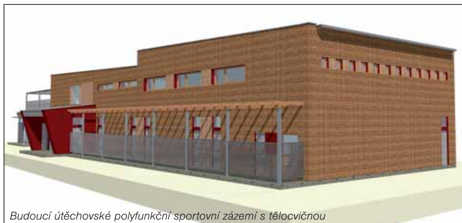
Budoucí útěchovské polyfunkční sportovní zázemí s tělocvičnou