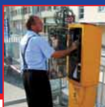
Kontrola automatů na dálku