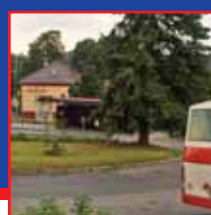
Útěchov řeší služby