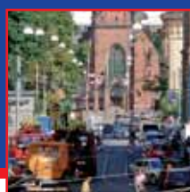
Oprava Husovy ve finále

Letní měsíce každého roku patří v brněnské dopravě tradičně údržbě, opravám a rekonstrukcím, zejména tramvajových tratí. S tím souvisí nutné a nepopulární výluky, které zejména cestujícím přinášejí různé komplikace. Nepočítáme-li stavební činnosti v centru města v podzemí ulic Husova a Pekařská, byla o prázdninách největší výlukovou akcí rekonstrukce silnice z Brna do Rajhradu, kdy se opravovaly mostní a kolejové objekty. Do Modřic se tak po dva měsíce jezdilo pouze autobusem. Obyvatelé Bosonoh se již jistě těší na konec rekonstrukce inženýrských sítí ve své městské části. Po tři týdny nejezdil také trolejbus na Preslovu ulici, kde komplikovala dopravu havárie kanalizace. Poslední z větších „letních“ akcí, využívající menší prázdninový provoz, je výměna kolejí na Mendlově náměstí, která skončí zároveň se zahájením provozu tramvají Pekařskou a Husovou. Autobusy si tak neodpočinuly ani o prázdninách. Zajistit náhradní dopravu za dráhu, to je úkol vždy a jen pro nezávislou trakci. Titulní snímek zachycuje přestupní uzel u Ústředního hřbitova s autobusem náhradní linky x2 do Modřic.