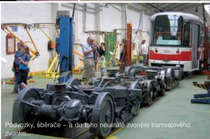
Podvozky, sběrače – a do toho neustálé zvonění tramvajového zvonku...