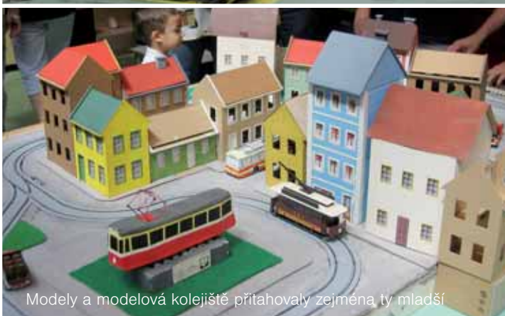
Modely a modelová kolejiště přitahovaly zejména ty mladší