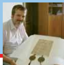
Tuřany čeká jubileum