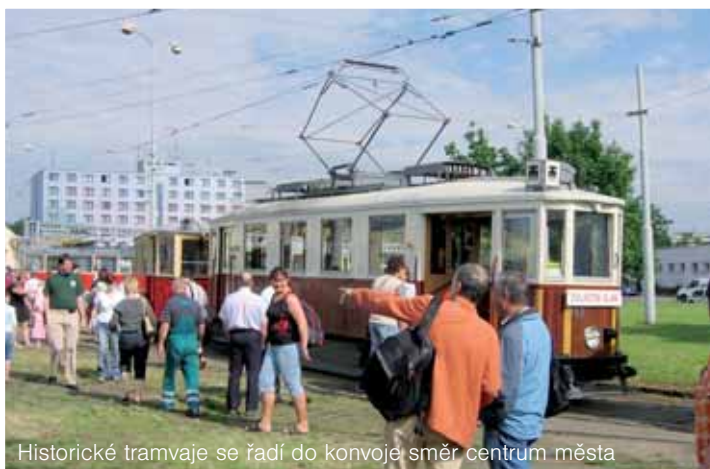
Historické tramvaje se řadí do konvoje směr centrum města