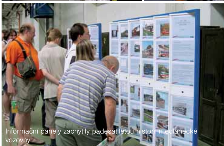
Informační panely zachytily padesátiletou historii medlánecké vozovny