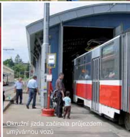
Okružní jízda začínala průjezdem umývárnu vozů