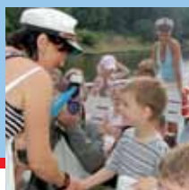
Vysvědčení na lodi

Proniknout za obvykle zavřené dveře různých institucí, jako jsou televizní studia, parlament nebo služebna hasičů, je přitažlivé. Také proto pořádá Dopravní podnik města Brna pravidelně své dny otevřených dveří. Připomenout zaslouží úspěch akce ve vozovně Slatina, v areálu lodní dopravy při jejich šedesátých narozeninách nebo letošní „den“ v Medláncích. I ten byl spojen s výročím. Medlánecká tramvajová vozovna slaví 50 let provozu. Právě odtud začaly vyjíždět první brněnské tramvaje moderního typu, známé jako T2, které brázdily brněnské ulice plných 40 let. Mnoho se za ta léta změnilo, a návštěvníci mohli porovnávat, jak pokročila dopravní technika v uplynulém století. Nezapomeňme ale, že dopravu dělají především lidé. Pasažéři a také dopraváci, kteří nepřetržitě slouží, aby všichni včas a bezpečně dorazili ke svému cíli.