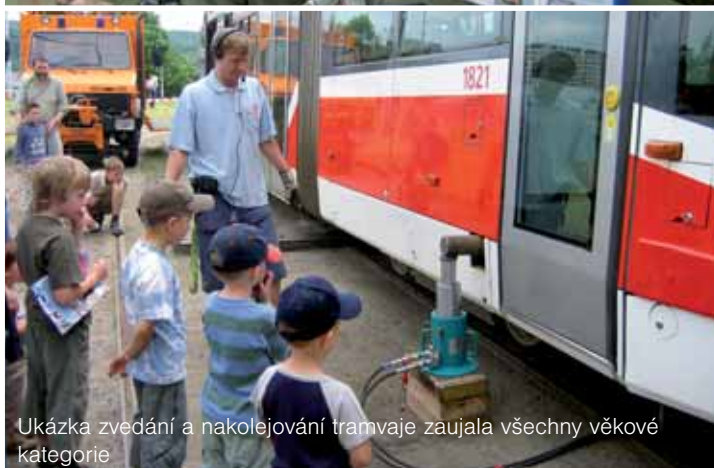
Ukázka zvedání a nakolejování tramvaje zaujala všechny věkové kategorie