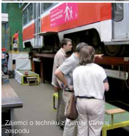
Zájemci o techniku zkoumají tramvaj zespodu