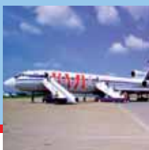
Z Brna letem světem a zpět str. 6