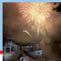
Než zakloníme hlavu k obloze str. 7