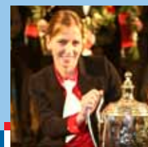
Sportovkyně Brna roku 2008 str.10-11