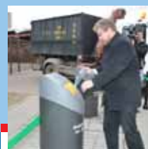
Brno separuje sběr i v centru str. 9