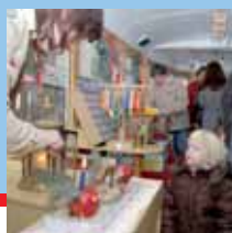
Brnem jela Betlémská tramvaj. str. 3